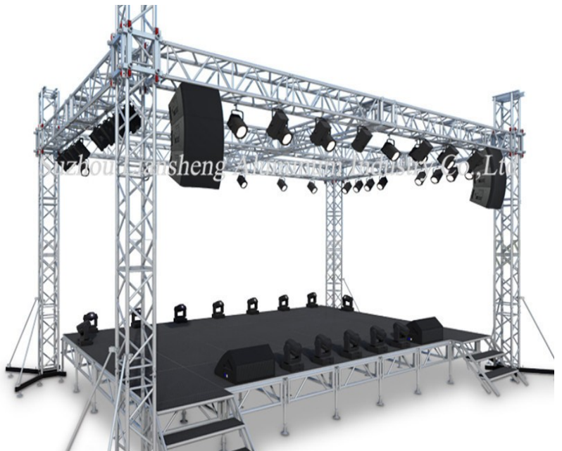
MODELO ORIENTATIVO DE MONTAJE DE ESCENARIO, TRUSS,