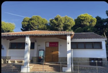
ZONA DE TALLERES