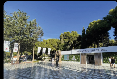
PLAZA DE LOS DESCUBRIDORES