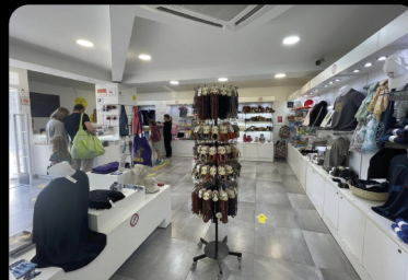
TIENDA DE RECUERDOS